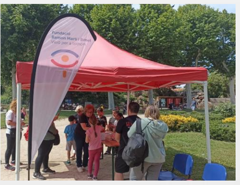
Jornada Zoolidària 25 de maig