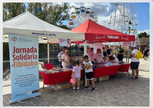
Jornada TibiVisió 7 de setembre