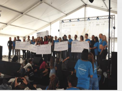
HP CharityJourney 5 d'octubre