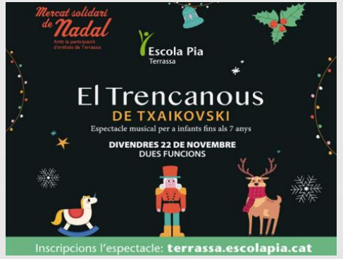
Mercat Solidari de Nadal de l'Escola Pia de Terrassa - 22 de novembre