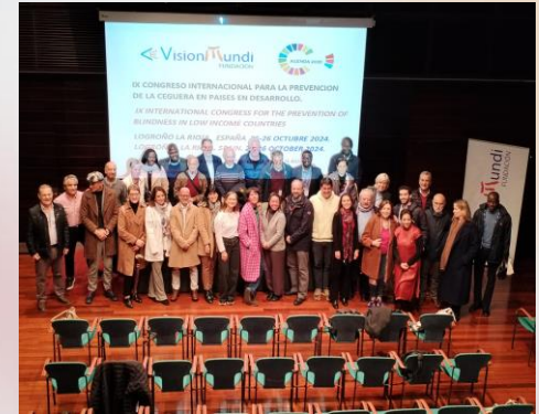
Conferència Logronyo 25 i 26 d'octubre