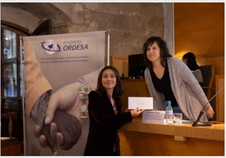
Entrega de premis Fundació Ordesa 21 de novembre