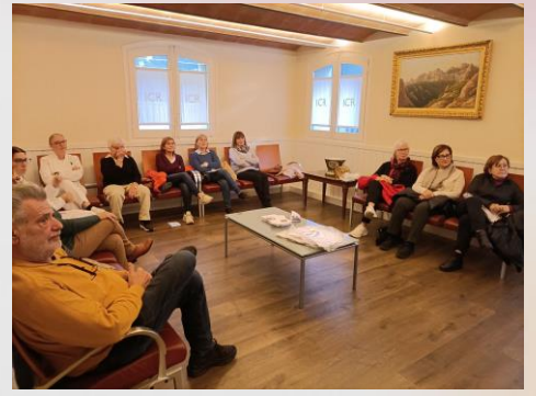
Formació equip de Voluntariat Terrassa 22 de novembre