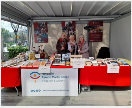
Diada de Sant Jordi 22 i 23 d'abril