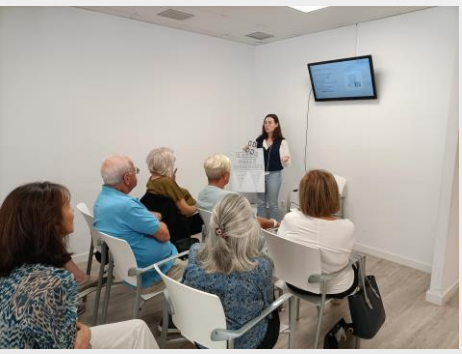
Formació equip de Voluntariat Barcelona 27 de setembre